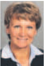
Von Rechtsanwältin Ulrike Hundt-Neumann, SvG StartUp-Desk